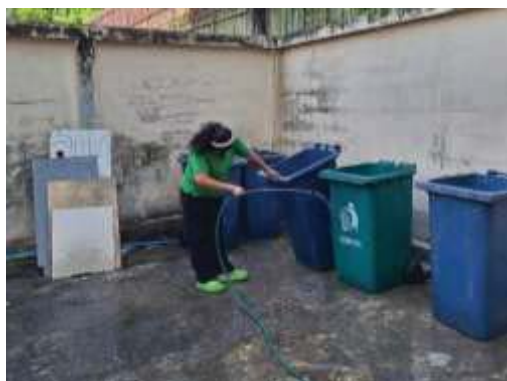
การล้างทำความสะอาดถังรองรับมูลฝอย