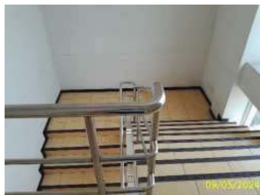
บันไดหนีไฟ