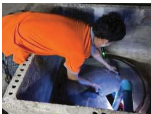
การตรวจเช็คระบบน้ำใช้