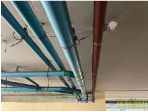
ท่อรวมน้ำเสีย