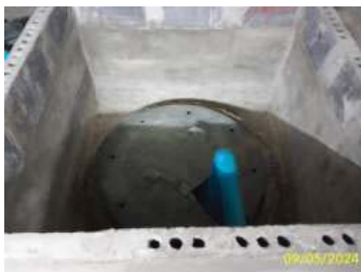
ปั๊มและถังเก็บน้ำใช้ใต้ดิน