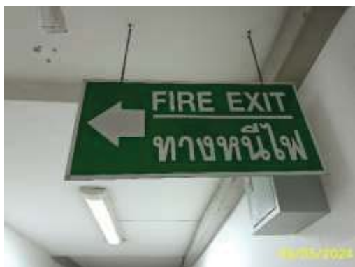
ป้ายแสดงเส้นทางหนีไฟ