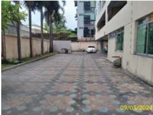
ทางเข้าพื้นที่จอดรถชั้นล่าง