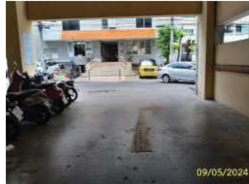
ทางออกพื้นที่จอดรถชั้นล่าง