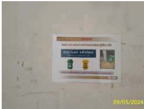
ป้ายเกี่ยวกับการทิ้งมูลฝอย