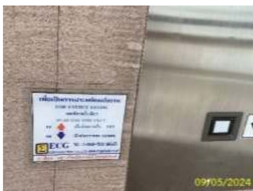
การณรงค์เกี่ยวกับการประหยัดพลังงาน