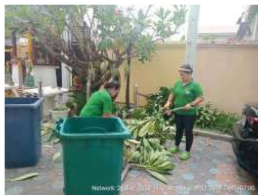
การบำรุงรักษาและตัดแต่งกิ่งต้นไม้โครงการ