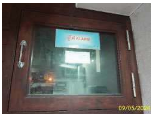
ตู้ควบคุมระบบแจ้งเหตุเพลิงไหม้