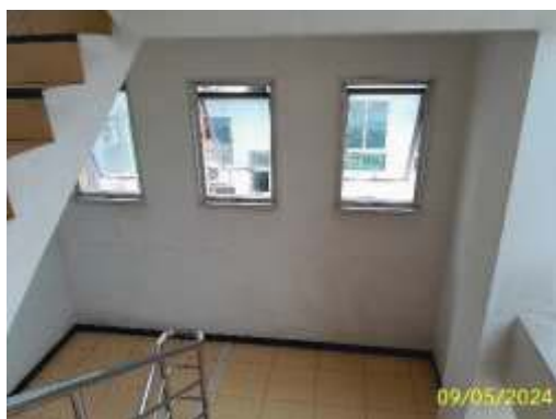
ช่องเปิดระบายอากาศ