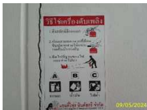
ป้ายแนะนำการใช้อุปกรณ์