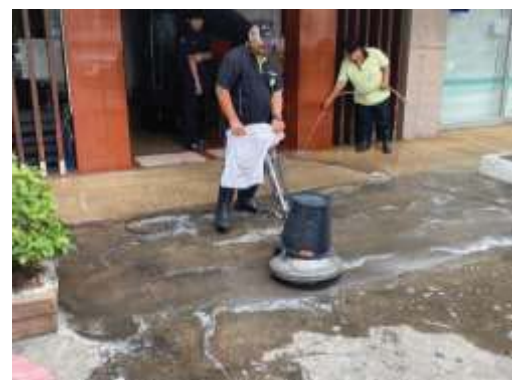
การล้างทำความสะอาดพื้นถนนและทางเดิน