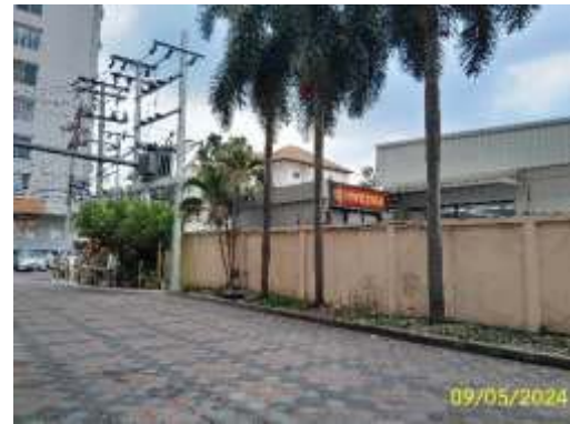
จุดจอดรถเก็บขนมูลฝอย