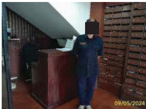
เจ้าหน้าที่รักษาความปลอดภัย