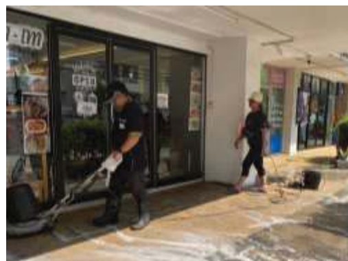
การทำความสะอาดบริเวณพื้นที่ส่วนกลาง