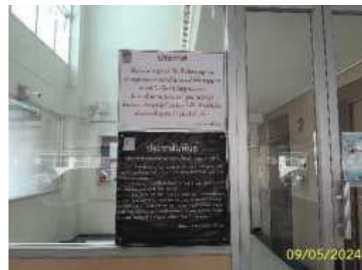
ป้ายเกี่ยวกับระเบียบการใช้พื้นที่จอดรถ