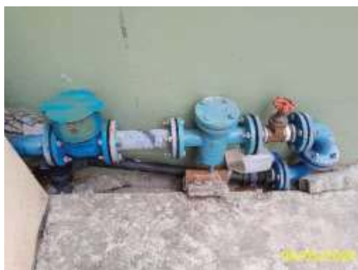
มิเตอร์รับน้ำประปา