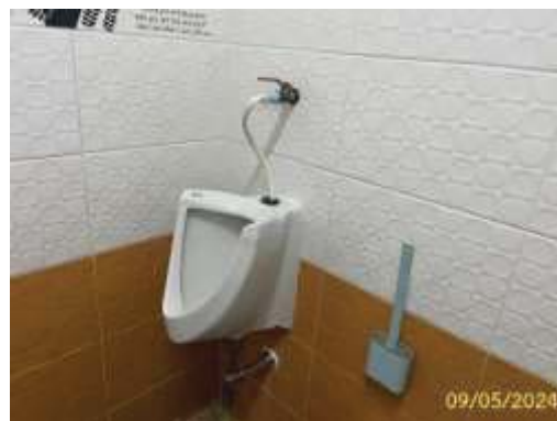
สุขภัณฑ์แบบประหยัดน้ำ