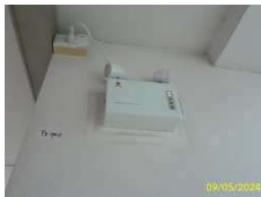
ไฟส่องสว่างฉุกเฉิน