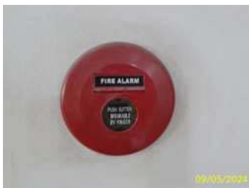
อุปกรณ์แจ้งเหตุเพลิงไหม้โดยใช้มือกด