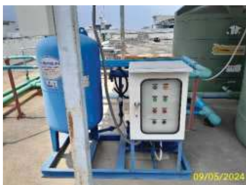
ปั๊มและถังเก็บน้ำใช้ชั้นดาดฟ้า