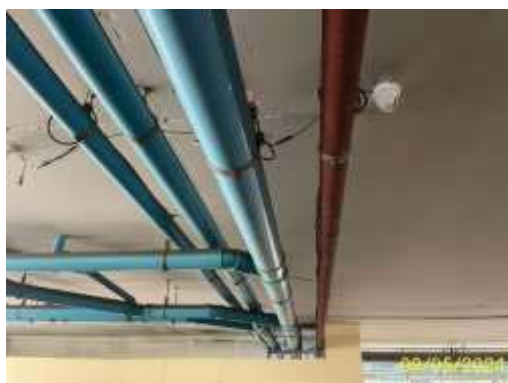
ท่อรวมน้ำเสีย