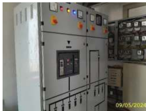
ห้องระบบไฟฟ้า (MDB)