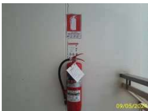
ถังดับเพลิงแบบมือถือ