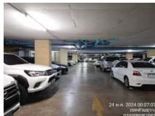
ไฟส่องสว่างตลอดแนวเส้นทางเดินรถและพื้นที่จอดรถในเวลากลางคืน