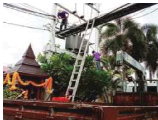
การตรวจสอบและซ่อมบำรุงหม้อแปลงไฟฟ้า