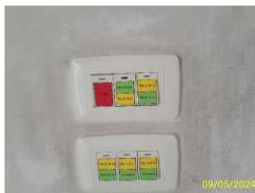
การกำหนดเวลาและสวิตช์แบบแยกเฉพาะจุด