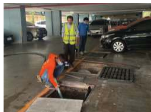
การสูบน้ำตะกอนส่วนเกินระบบบำบัดน้ำเสีย