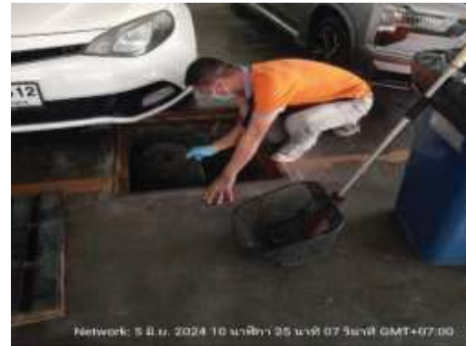
การตักกากตะกอนไขมัน