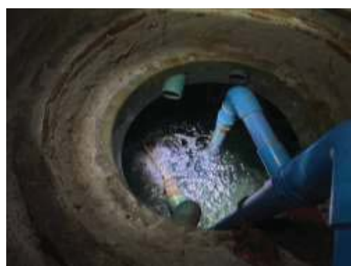
ภาพที่ 2.2-4 การจัดการน้ำใช้