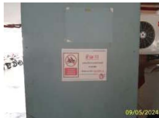
ป้ายเกี่ยวกับระเบียบการใช้พื้นที่จอดรถ