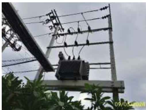
หม้อแปลงไฟฟ้า