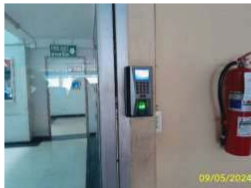
ระบบควบคุมการเข้า-ออกอาคาร