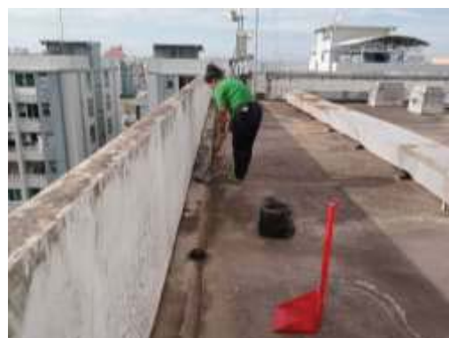
การทำความสะอาดรางระบายน้ำ