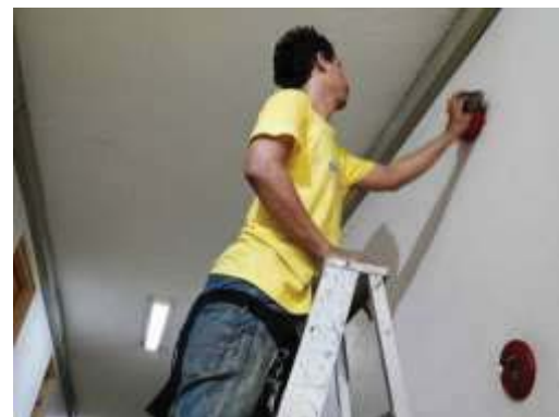
การตรวจสอบอุปกรณ์ในระบบป้องกันอัคคีภัย