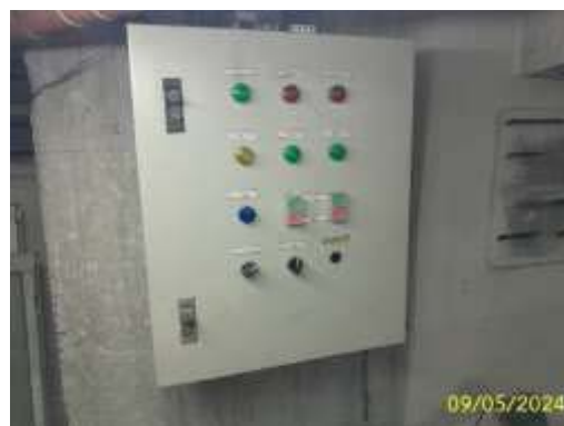
ตู้ควบคุมระบบน้ำใช้