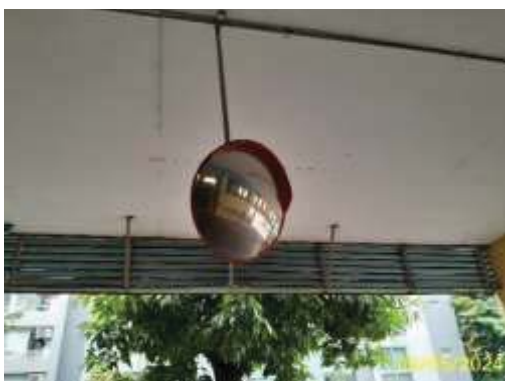
กระจกนูนบริเวณทางแยก