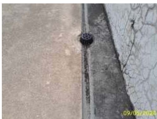
หัวรับน้ำฝน