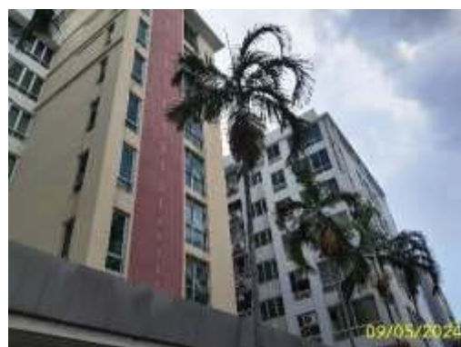
สีตัวอาคารโทนอ่อนและกระจุยเขียวแบบตัดแสง