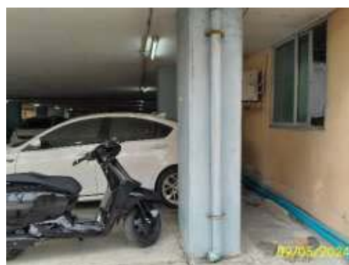
ท่อระบายน้ำฝน