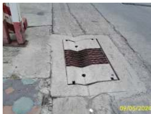
แนวบ่อหนองน้ำและท่อระบายน้ำหน้าโครงการ