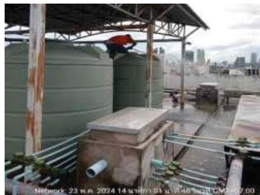
การล้างทำความสะอาดถังเก็บน้ำใช้