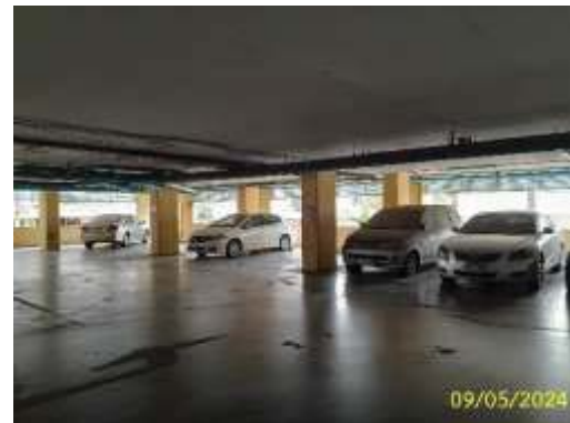
พื้นที่จอดรถ