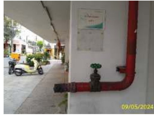
หัวรับน้ำดับเพลิง