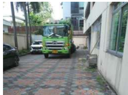
สำนักงานเขตห้วยขวางเข้ามาเก็บขนมูลฝอยไปกำจัด