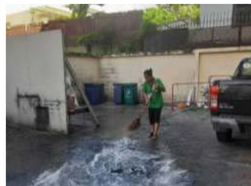
การล้างทำความสะอาดบริเวณจุดพักมูลฝอยรวม