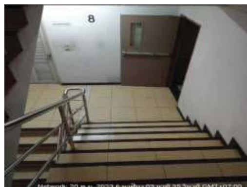
แสงสว่างภายในและนอกอาคารในเวลากลางคืน