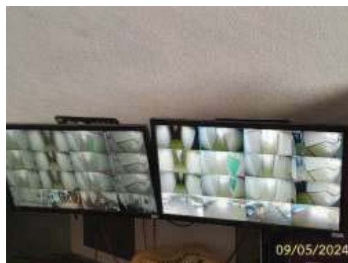
ระบบกล้องวงจรปิด (CCTV)