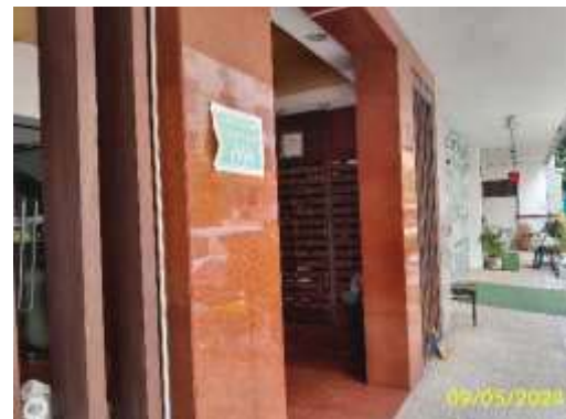
จุดรวมพล