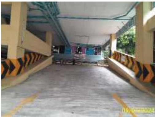
ทางเข้า-ออกพื้นที่จอดรถชั้น 2