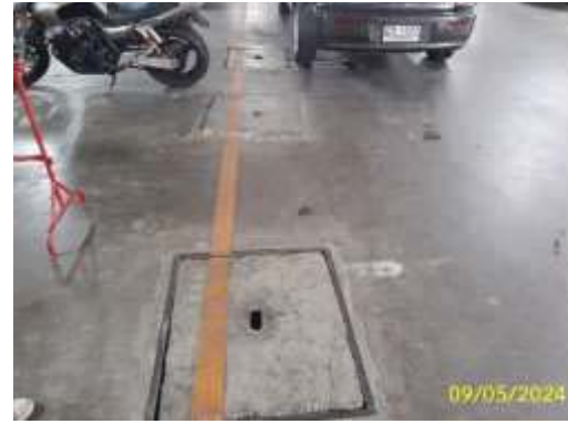
จุดที่ตั้งระบบบำบัดน้ำเสีย