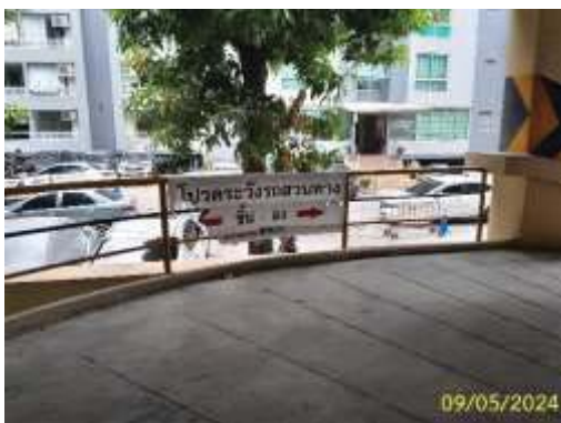
ป้ายเตือนระวางบริเวณจุดเสี่ยง