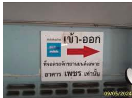
ป้ายแนะนำทิศทางการเดินรถ